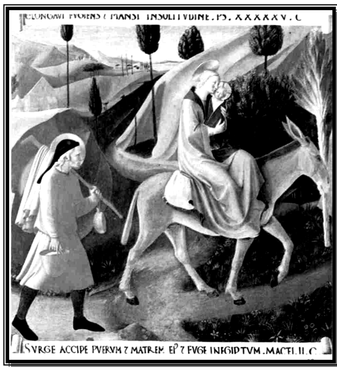
Fra Angélico (1387-1455). Episódio da Fuga do Egito p.59. Abril Cultural.